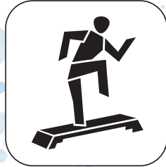
Fitness für Alle