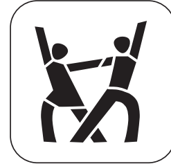
Tanzen im TVT